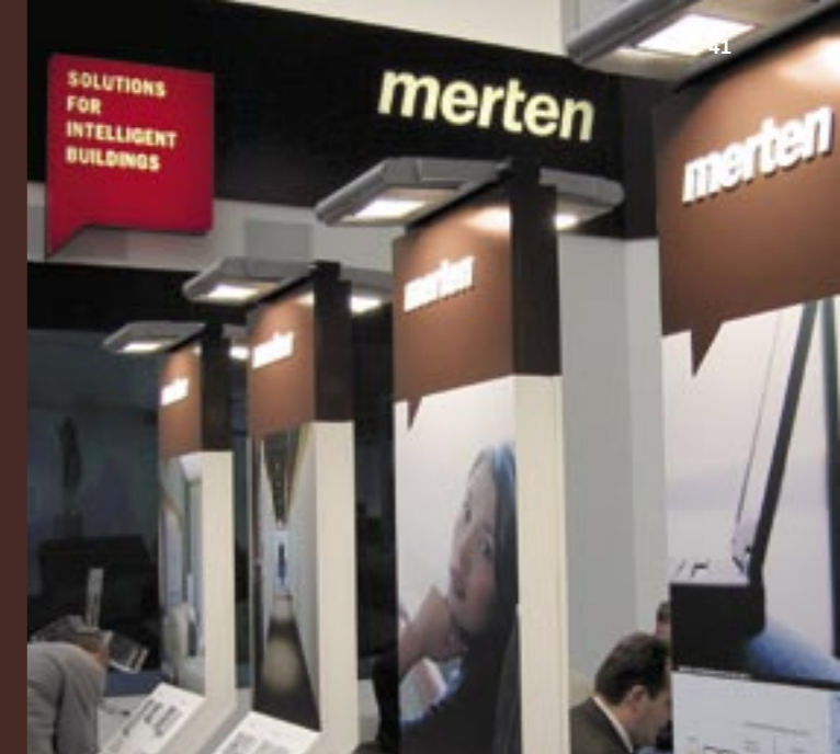
Neuer Messeauftritt New trade show booth