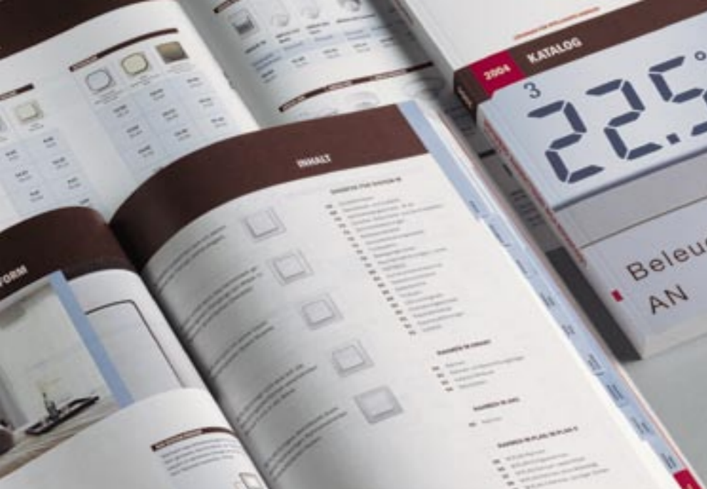
Printmedienkonzept Print media concept