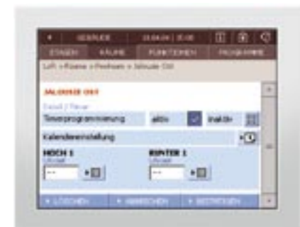
Gebäudesystemsteuerung, z. B. über PDA oder Touchscreen Controlling building functions via a PDA or touch screen

Mit Merten und MetaDesign treffen sich zwei Partner im Premiumsegment: Der Gebäudespezialist Merten bietet beste Lösungen für intelligente Gebäude. MetaDesign agiert in der Spitzengruppe der renommierten CI-/CD-Agenturen. „Das ist ein Grund für Merten gewesen, sich an MetaDesign zu wenden“, weiß Klein. „MetaDesign ist eine Premiummarke. Allein deshalb weiß MetaDesign, wie die Visualisierung von Premiumprodukten funktioniert!“