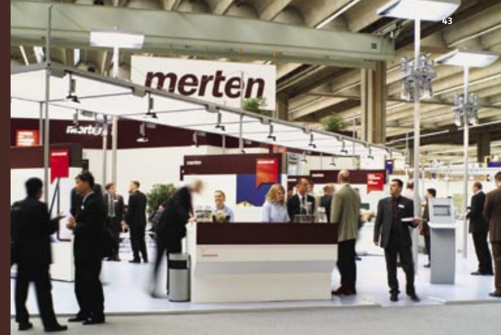
Blick auf den neuen Messestand View of the new trade show booth