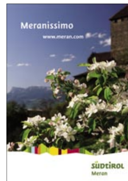
Anzeigenkampagne für die Region Meran Campaign for the Meran region

The new umbrella brand pools the energies of the over 150 individual brands that had previously produced varying images for South Tyrol, thus failing to increase the value of the whole in their diverse communication activities. Even so, although the new presence is consistent, it is by no means uniform. The individual brands have strengthened their own images, yet thanks to the “common denominator” of the