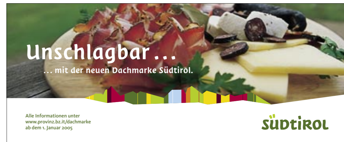
Einführungskampagne der Dachmarke Südtirol Launch campaign for the South Tyrol umbrella brand

Die neue Dachmarke bündelt die Stärken von über 150 Einzelmarken, die bislang ein sehr unterschiedliches Südtirol-Bild prägten und auf kein gemeinsames kommunikatives Konto einzahlten. Dennoch geht es bei aller Konsistenz im Auftritt keineswegs um Uniformität. Im Gegenteil, die Einzelmarken stärken ihr eigenes Profil. Durch den gemeinsamen Nenner aber, die Dachmarke Südtirol, entsteht im Zusammenspiel der einzelnen Kommunikationselemente das Gesamtbild, eben unverwechselbar Südtirol.